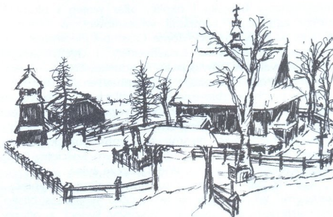
Kościół w Gosprzódowej z dzwonnica, figurą Maryi i domem parafialnym.