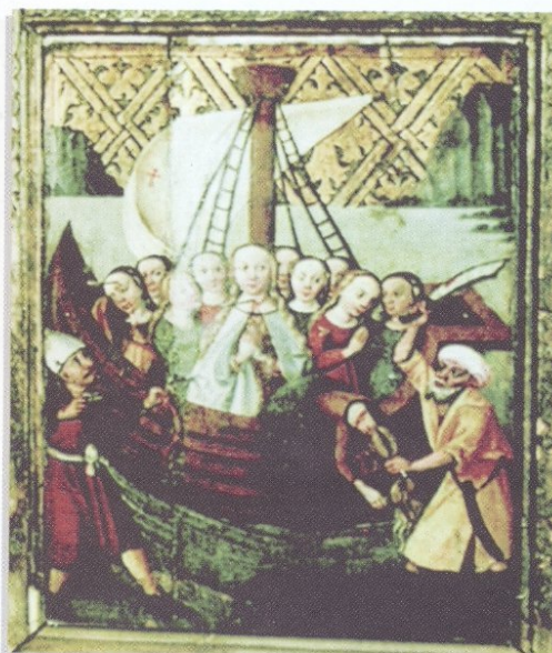
Fot. o. Jerzy Bakalarz. Św. Urszula i Towarzyszki – jedna z kwater tryptyku z Gosprzydowej. Obecnie w Muzeum Diecezjalnym w Tarnowie

W XVI w. kult 11 tys. Dziewic był już w Polsce ukształtowany. W Krakowie istniało Bractwo św. Urszuli i Towarzystek przy kościele św. Szczepana. Zaś z Krakowa płynęły wzory ówczesnego życia – w tym także religijnego. W tym czasie w sąsiedniej Lipnicy Murowanej powstał czwarty już w dziejach parafii kościół, na Przedmieściu Dolnym, który został dedykowany także 11 tysiącom Dziewic. Później określany był